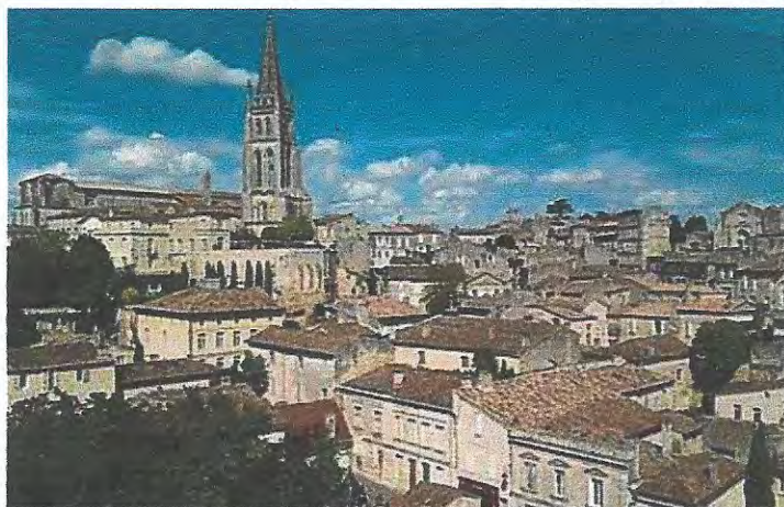
La cité et le clocher de l'église monolithe

Au cœur du pays du Libournais, dans une région de collines viticoles, cette cité médiévale est campée sur un coteau calcaire. C'est un site touristique de premier plan.