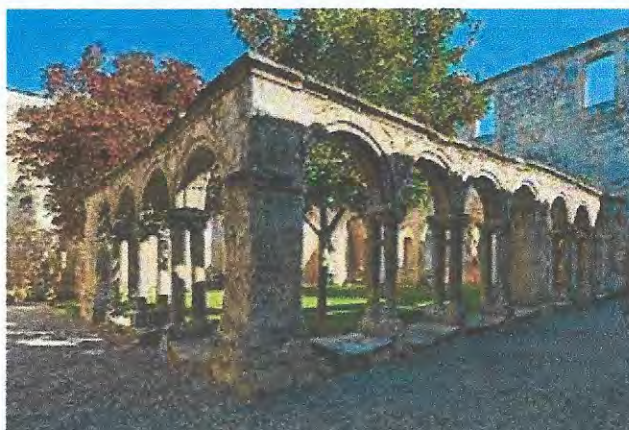
Le cloître des Cordeliers

Depuis 1999 la cité médiévale et son vignoble sont inscrits au patrimoine mondial de l'humanité par l'Unesco. Saint-Emilion est aujourd'hui l'exemple remarquable d'un paysage viticole historique qui a survécu intact et qui illustre de manière exceptionnelle la culture de la vigne.